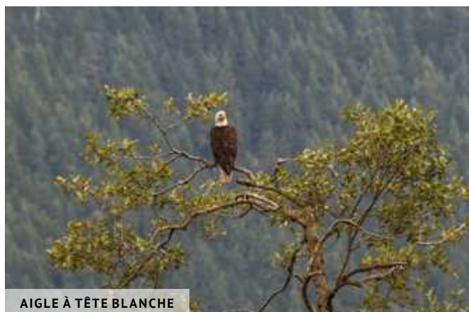
AIGLE À TÊTE BLANCHE