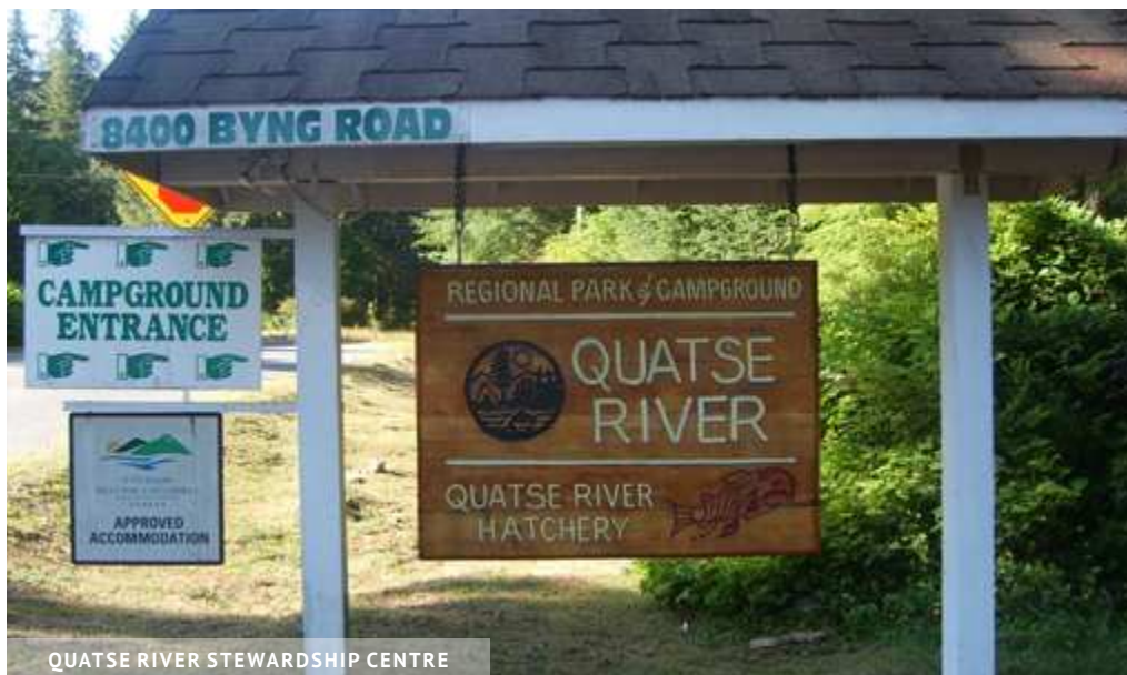
QUATSE RIVER STEWARDSHIP CENTRE