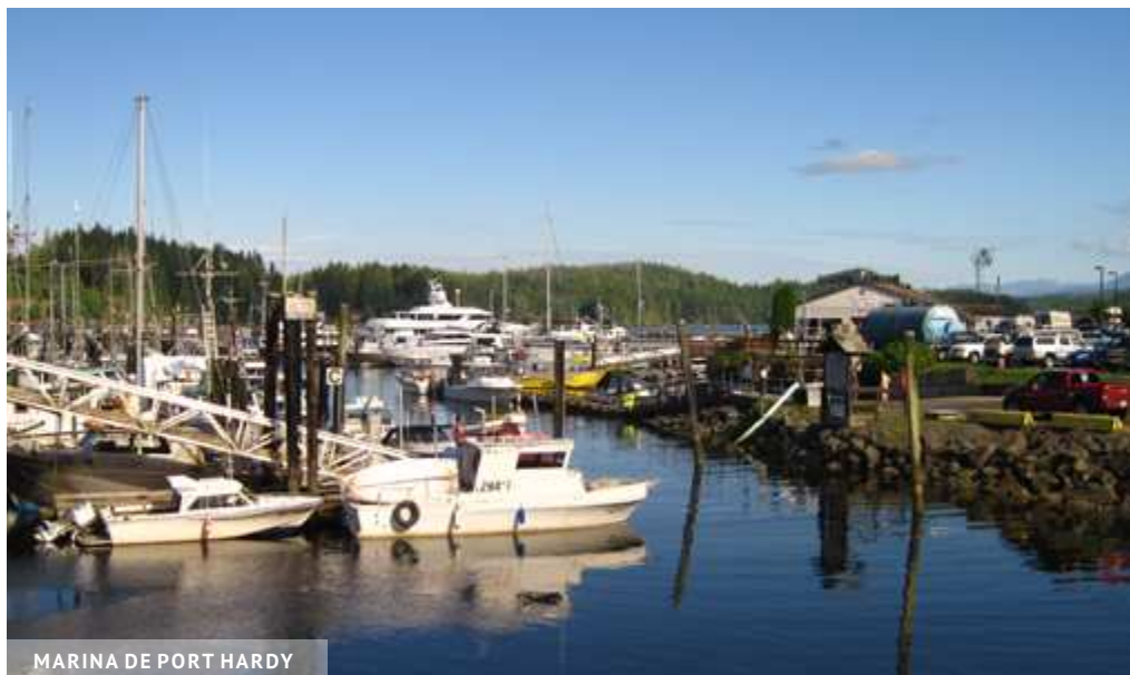
MARINA DE PORT HARDY

En bordure de la rivière Quatse, il est possible de faire l'observation de l'aigle royal . De nombreux autres oiseaux sauvages survolent l'observatoire de l'estuaire de la rivière Quatse.