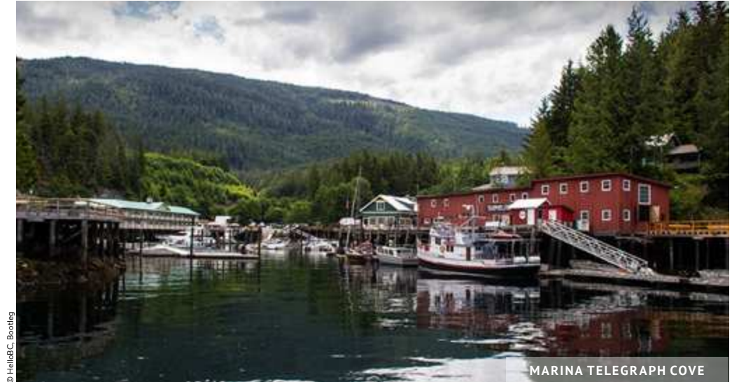
MARINA TELEGRAPH COVE

Telegraph Cove ★★★ est un magnifique et charmant village . L'endroit est touristique, mais paisible. Une promenade ici vous laissera avec une impression d'être ailleurs, à une autre époque. C'est également le départ de croisières aux baleines ou d'exploration en kayak. D'après le très célèbre Jacques Cousteau, Telegraph Cove serait d'ailleurs le meilleur endroit au monde pour observer les orques ! Une grande population d'orques s'y réfugie pendant la saison estivale, augmentant vos chances de les voir dans leur milieu naturel.