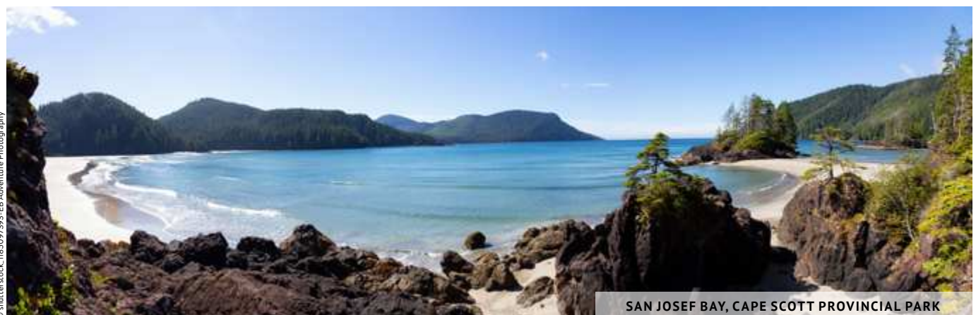
SAN JOSEF BAY, CAPE SCOTT PROVINCIAL PARK