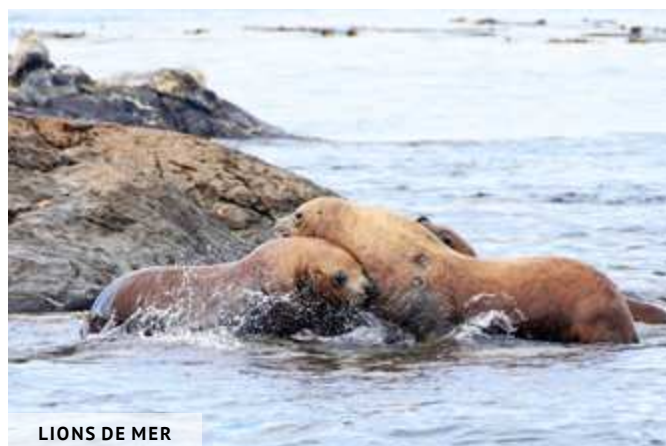
LIONS DE MER