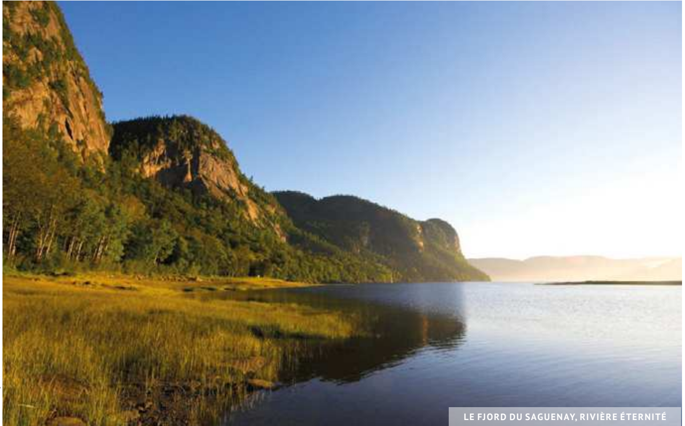
LE FJORD DU SAGUENAY, RIVIÈRE ÉTERNITÉ