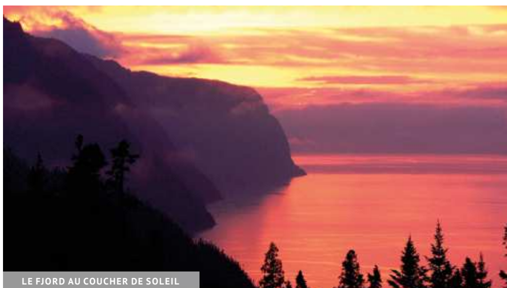
LE FJORD AU COUCHER DE SOLEIL