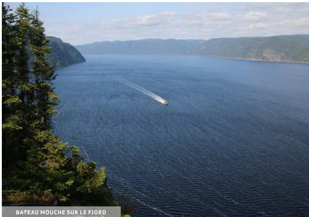
BATEAU MOUCHE SUR LE FJORD

CROISIÈRE DU FJORD : DÉPART À LA BILLETTERIE AU QUAI MUNICIPAL, 355, RUE ST-JEAN-BAPTISTE, L'ANSE-SAINT-JEAN 418-543-7630 WWW.NAVETTESDUFJORD.COM