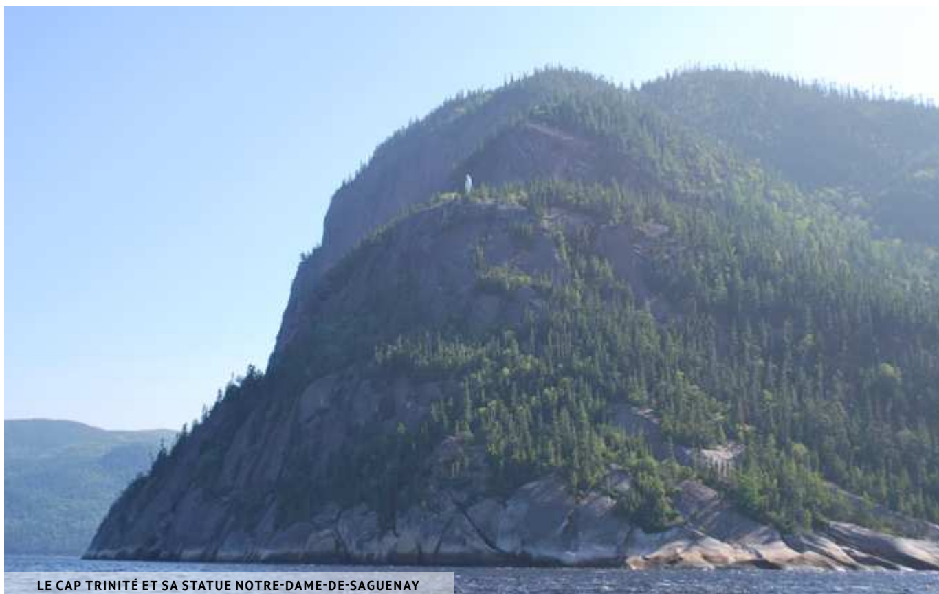
LE CAP TRINITÉ ET SA STATUE NOTRE-DAME-DE-SAGUENAY

du Saguenay. Trois itinéraires aménagés avec des câbles sont proposés, d'une durée de 3, 4 ou 6 heures et de niveau de difficulté intermédiaire à avancé. Le parcours se fait accompagné d'un guide. Il faut être âgé de 12-14 ans minimum. Ouvert du début juin à la mi-octobre. 91, NOTRE-DAME, RIVIÈRE-ÉTERNITÉ 418-272-1556