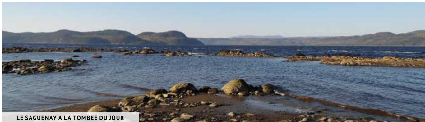
LE SAGUENAY À LA TOMBÉE DU JOUR