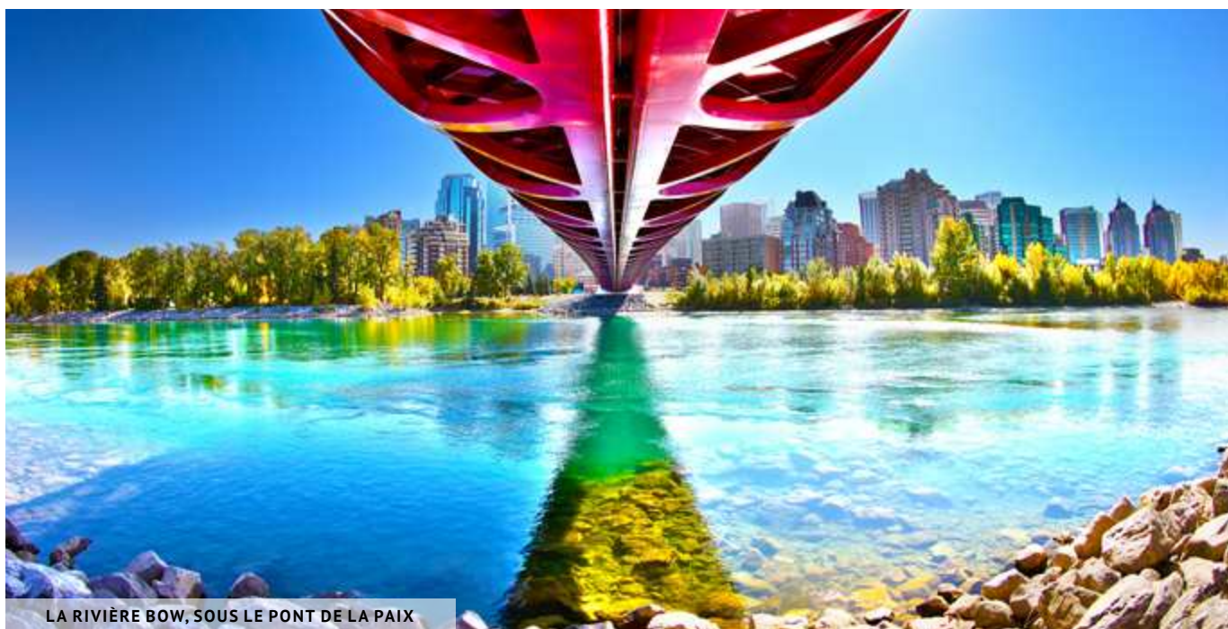
LA RIVIÈRE BOW, SOUS LE PONT DE LA PAIX