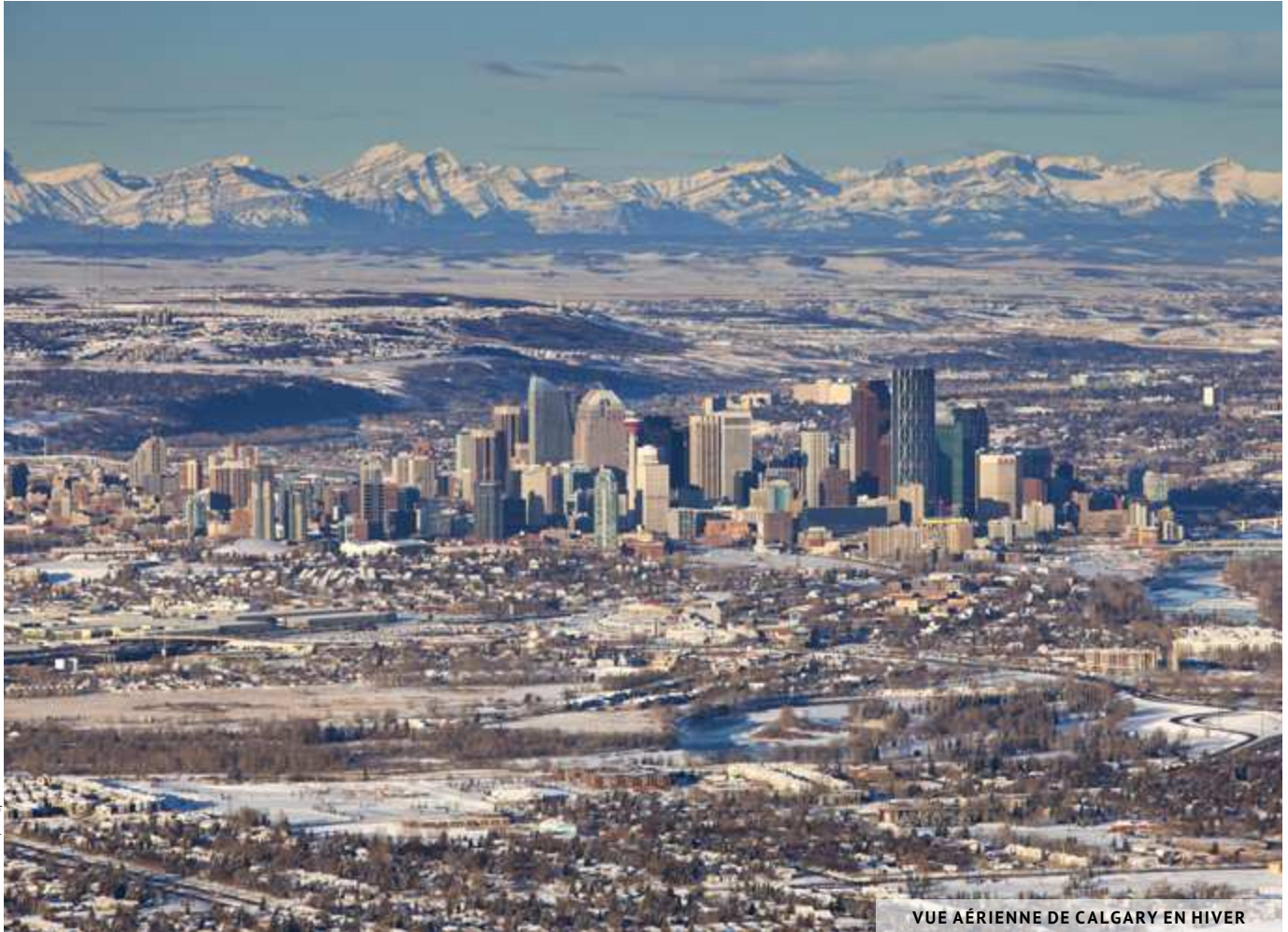
VUE AÉRIENNE DE CALGARY EN HIVER