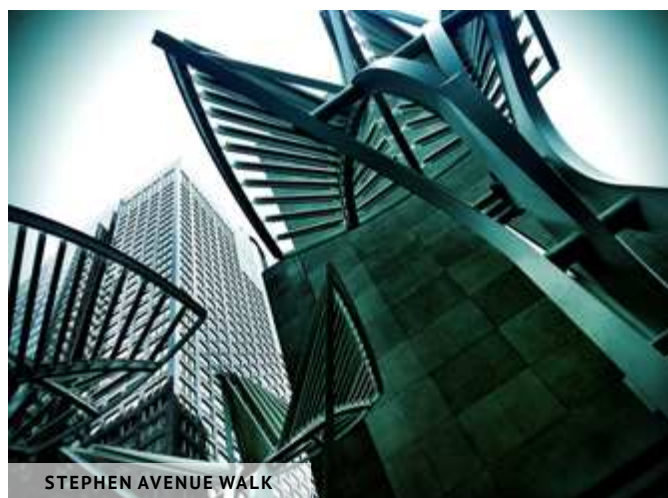
STEPHEN AVENUE WALK