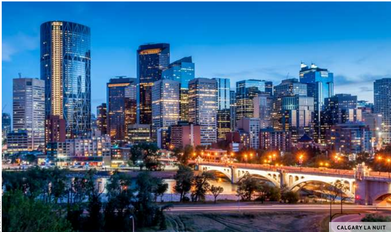
CALGARY LA NUIT