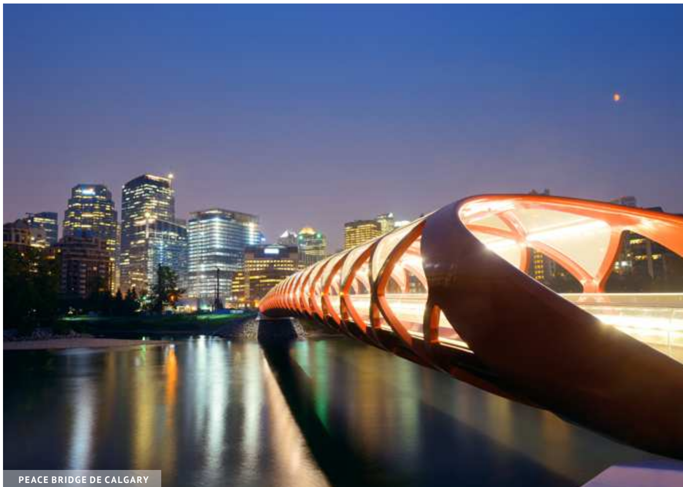
PEACE BRIDGE DE CALGARY