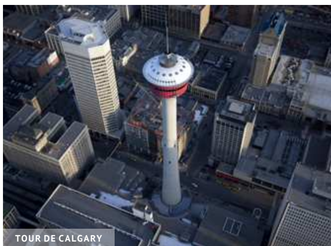
TOUR DE CALGARY

Situé dans une des seules portions piétonnes du centre-ville, ce centre commercial à ciel ouvert vous permettra de faire vos emplettes et de rapporter des souvenirs de votre périple dans l'Ouest canadien. C'est plus précisément entre la 1 st Street SE et la 4 th Street SW que l'action se passe.